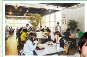
「伝説の味」 シャブスを 食べることができた 喫茶パロン