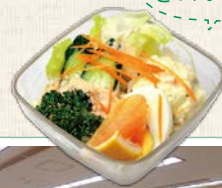
サラダ 180円 色どりもキレイ