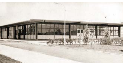
1966年、 開学間もない頃の 学生食堂全景