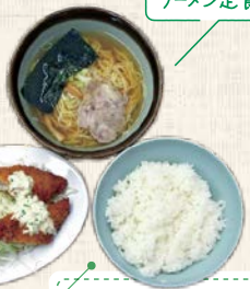
2019年の ラーメン定食