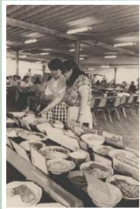
毎日、提供される 本物の料理が 入口脇に並んでいた (1985年)