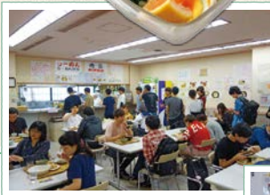
Via1階で営業中の中華「華和」。 メニューがハンパなく豊富。