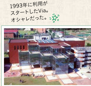
1993年に利用が スタートしたVia。 オシャレだった。