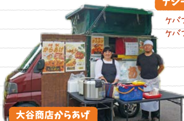
大谷商店からあげ