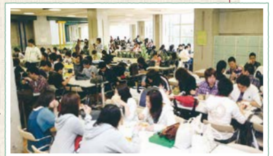
2階のフロアー全景。 席の確保が大変だった。