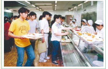
2階の食をにっていた カフェテリア形式のレストラン。 毎日混雑していた。