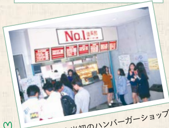
1993年開店当初のハンバーガーショップ。 女子に人気が高かった。